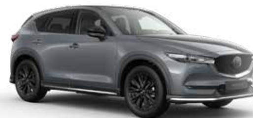
Mazda CX-5 met Sport pakket