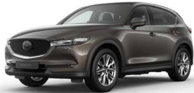
TITANIUM FLASH MICA