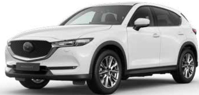
ARCTIC WHITE SOLID