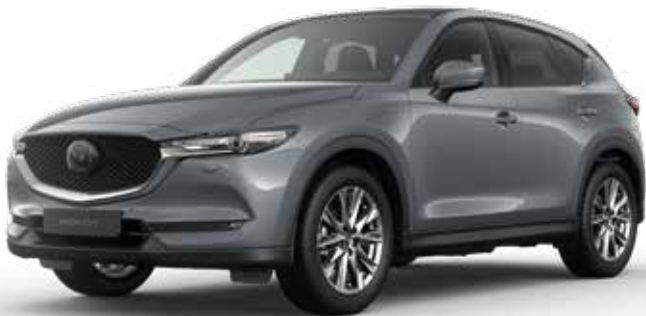
POLYMETAL GRAY METALLIC

Je hebt de keuze uit tien kleuren. Arctic White Solid vormt de basis. Machine Gray Metallic en Soul Red Crystal Metallic zijn het meest exclusief. Een speciale laktechniek met nog kleinere en heldere aluminiumdeeltjes zorgt voor een ongekend diepe, heldere kleur.