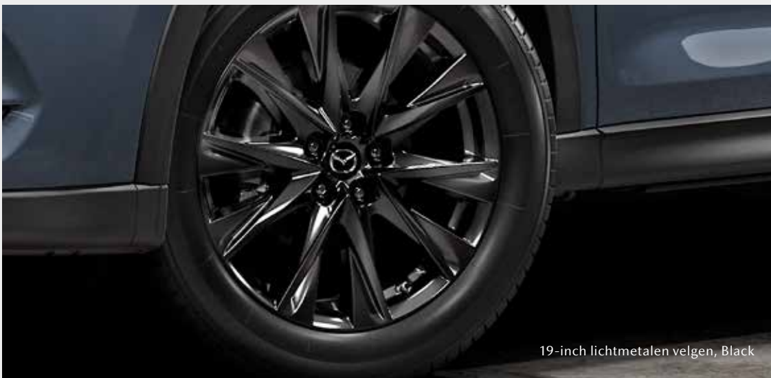
19-inch lichtmetalen velgen, Black