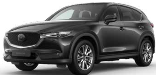
JET BLACK MICA