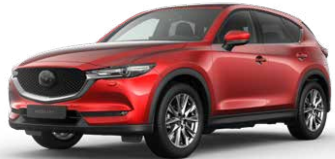
SOUL RED CRYSTAL METALLIC