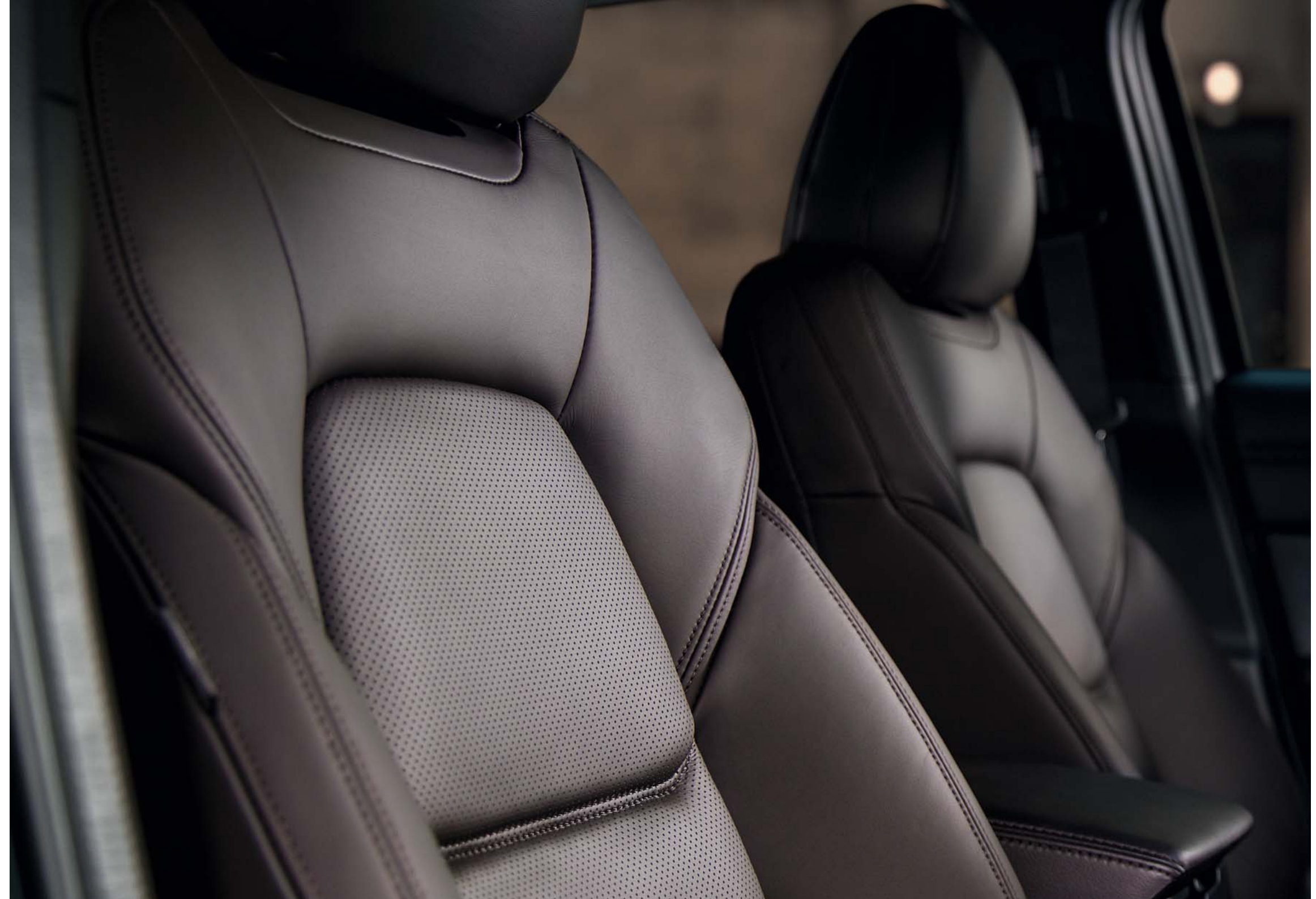
Foto: Mazda CX-5 als Signature uitvoering met donkerbruin Nappa-lederen interieur

Mazda beseft hoe belangrijk de zintuigen zijn voor de beleving. Door de zorgvuldig gekozen materialen en kleurenschema's oogt het interieur minder druk. De combinatie van zachte materialen, stevige stiksels en rustgevende vormgeving zorgen voor een uniek interieur wat je zintuigen aanspreekt. Of je nu kiest voor een stoffen of lederen interieur.