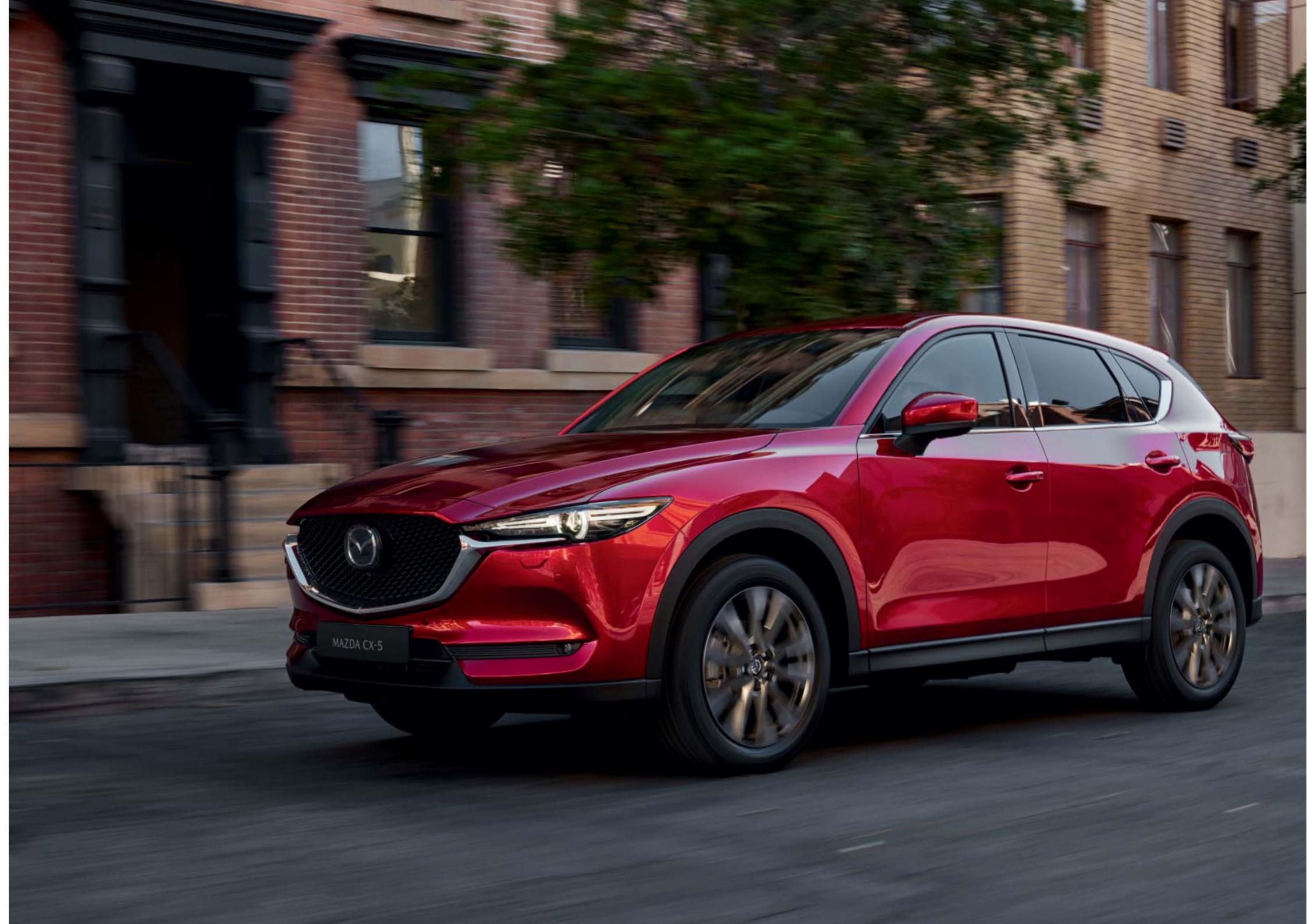
Foto rechts: Mazda CX-5 als Signature uitvoering in Soul Red Crystal