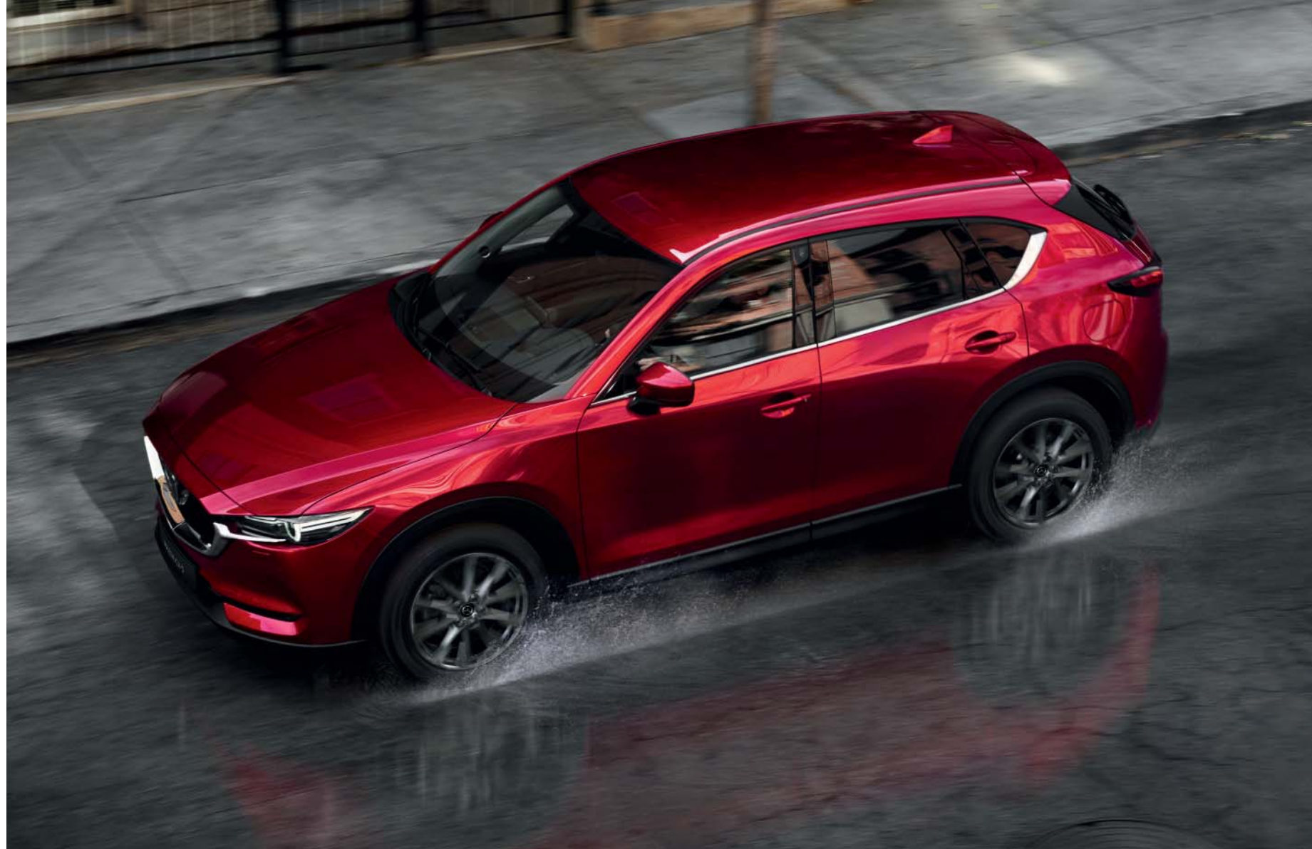
Foto: Mazda CX-5 als Luxury uitvoering in Soul Red Crystal