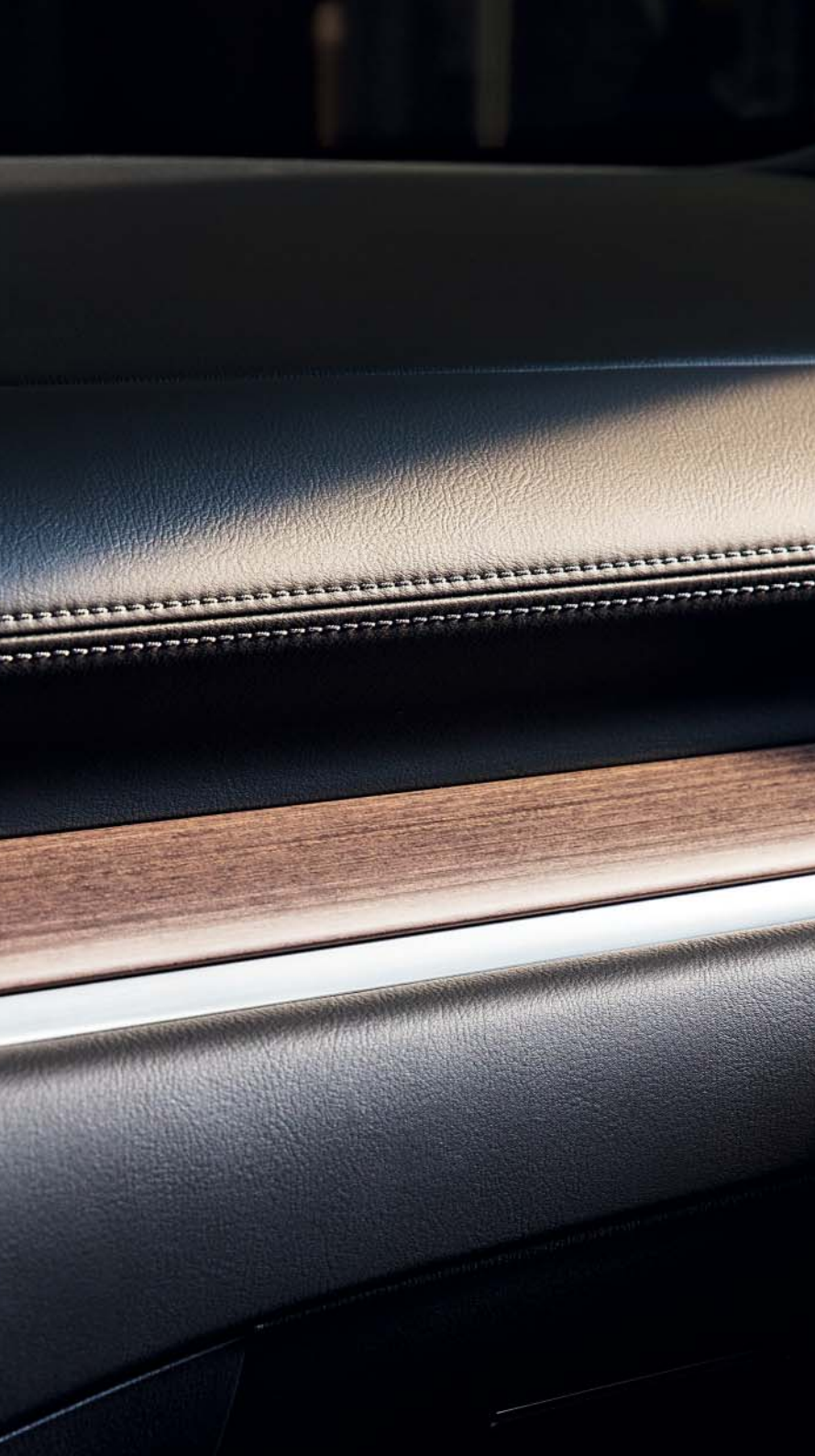
Foto's: Mazda CX-5 als Signature uitvoering met donkerbruin Nappa-lederen interieur en accenten van Japans Sen-hout