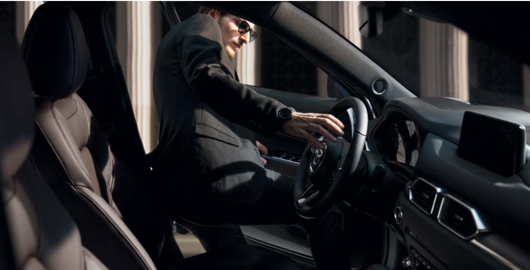
Foto links: Mazda CX-5 als Signature uitvoering Foto rechts: Mazda CX-5 als Luxury uitvoering in Soul Red Crystal

Sinds zijn introductie gooit de Mazda CX-5 hoge ogen, en won hij prijs op prijs. Met de nieuwe versie doen we daar nog een schepje bovenop. De hoge instap, de hoge trekkracht en het hoge afwerkingsniveau maken de verwachtingen meer dan waar. Maar het zijn de rijeigenschappen die hem echt naar grote hoogte brengen. Door een uitgebalanceerd onderstel stuurt hij als een sportieve sedan, waardoor elke bestuurder zich één voelt met de auto. En dat is ongekend voor dit segment.