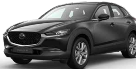
JET BLACK MICA € 800