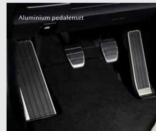
Aluminium pedalen, incl. voetsteun