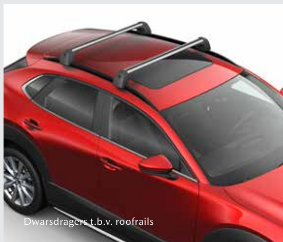
Dwarsdragers t.b.v. roofrails