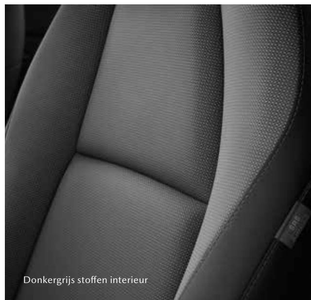
Donkergrijs stoffen interieur