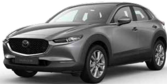
MACHINE GRAY METALLIC € 1.000