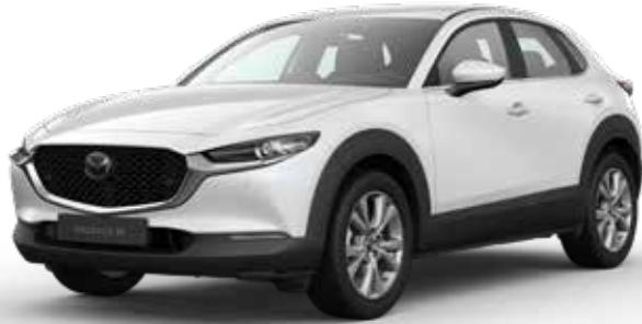
SNOWFLAKE WHITE PEARL € 800