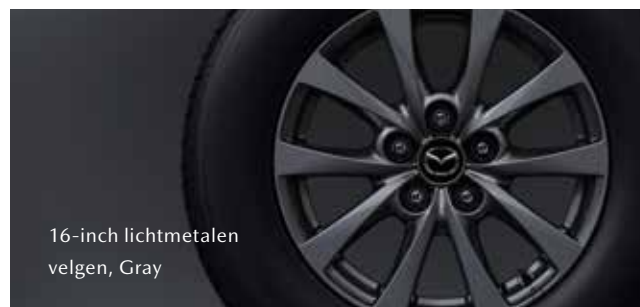
16-inch lichtmetalen velgen, Gray