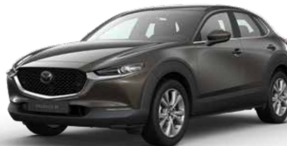
TITANIUM FLASH MICA € 800