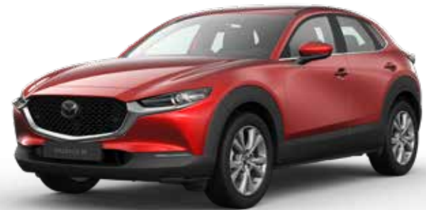
SOUL RED CRYSTAL METALLIC € 1.150