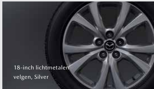
18-inch lichtmetalen velgen, Silver