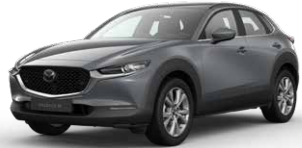
POLYMETAL GRAY METALLIC € 800