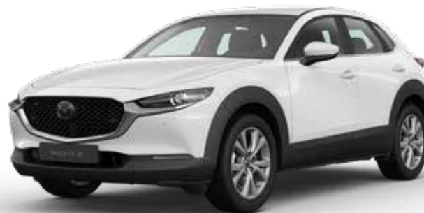
ARCTIC WHITE SOLID

Je hebt keuze uit negen kleuren. Arctic White Solid vormt de basis. Machine Gray Metallic en Soul Red Crystal Metallic zijn het meest exclusief. Een speciale laktechniek met nog kleinere en heldere aluminiumdeeltjes zorgt voor een ongekend diepe, heldere kleur.