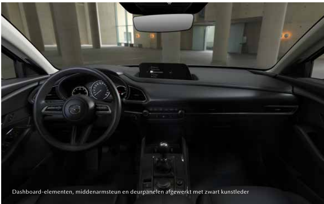
Dashboard-elementen, middenarmsteun en deurpanelen afgewerkt met zwart kunstleder