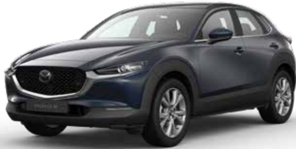
DEEP CRYSTAL BLUE MICA € 800