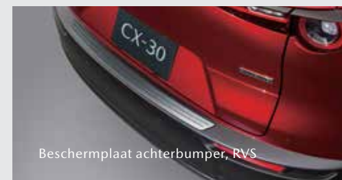
Beschermplaat achterbumper, RVS