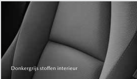
Donkergrijs stoffen interieur