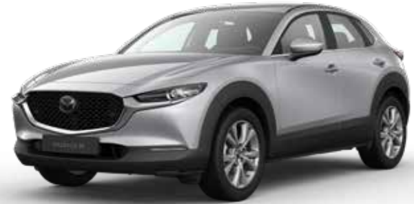
SONIC SILVER METALLIC € 800