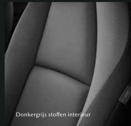
Donkergrijs stoffen interieur