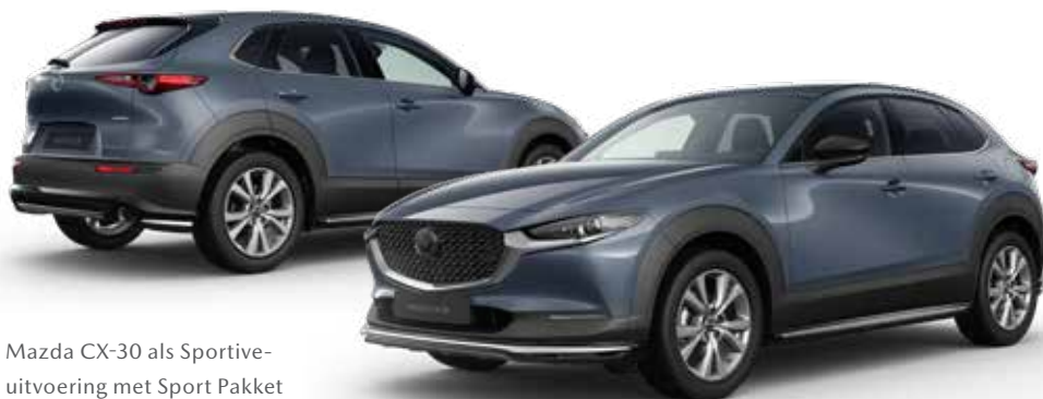
Mazda CX-30 als Sportive-uitvoering met Sport Pakket

SPORT PAKKET Geschikt voor alle Mazda CX-30-uitvoeringen