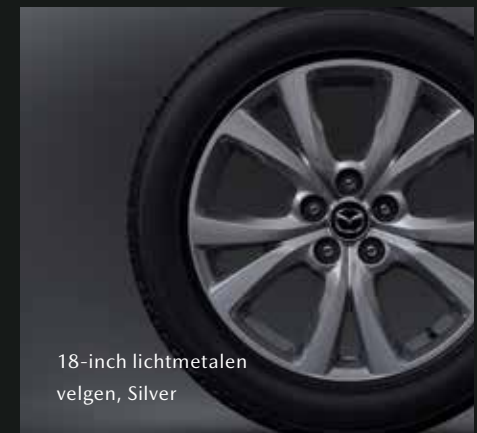
18-inch lichtmetalen velgen, Silver