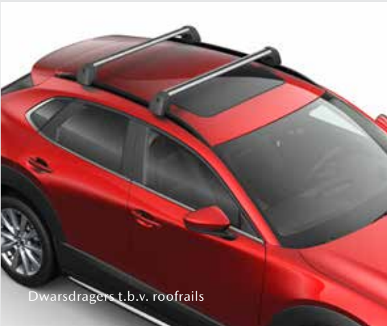
Dwarsdragers t.b.v. roofrails