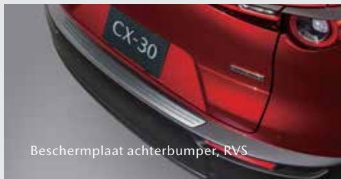
Beschermplaat achterbumper, RVS