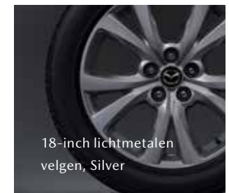
18-inch lichtmetalen velgen, Silver