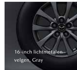
16-inch lichtmetalen velgen, Gray