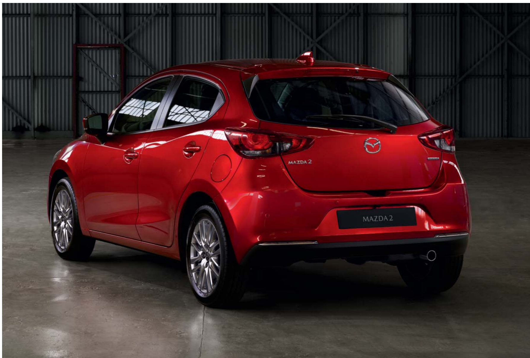
Foto: Mazda2 als Signature uitvoering in Soul Red Crystal