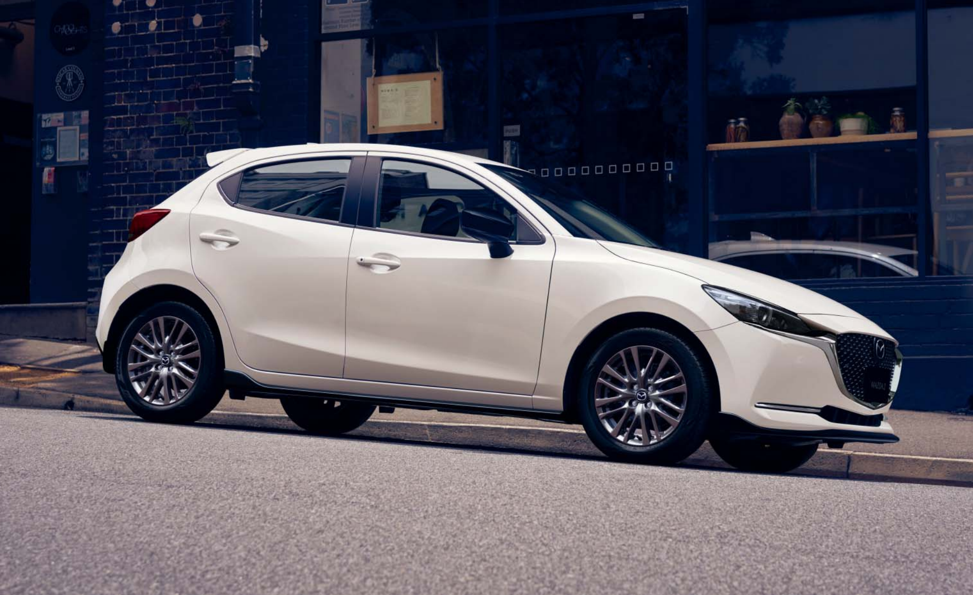
Foto boven: Mazda2 als Signature uitvoering in Snowflake White Pearl, aangevuld met o.a. zijskirts en zwarte spiegelkappen