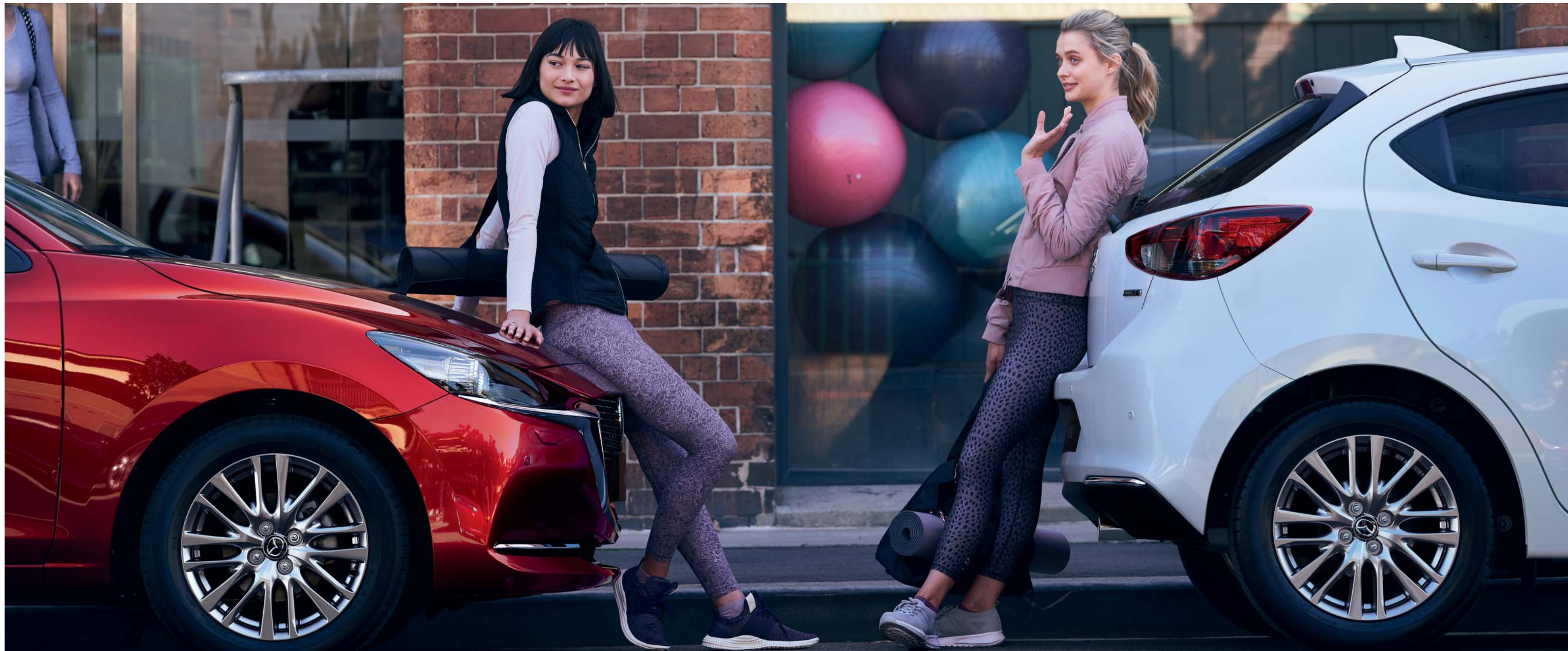
Foto boven, links: Mazda2 als Signature uitvoering in Soul Red Crystal