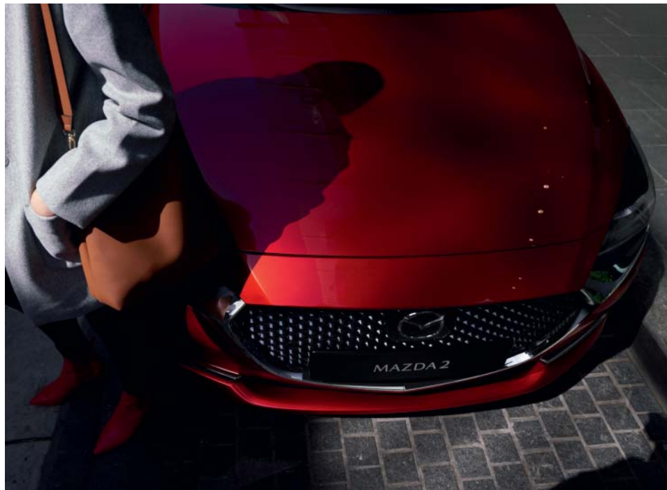
Foto: Mazda2 als Signature uitvoering in Soul Red Crystal