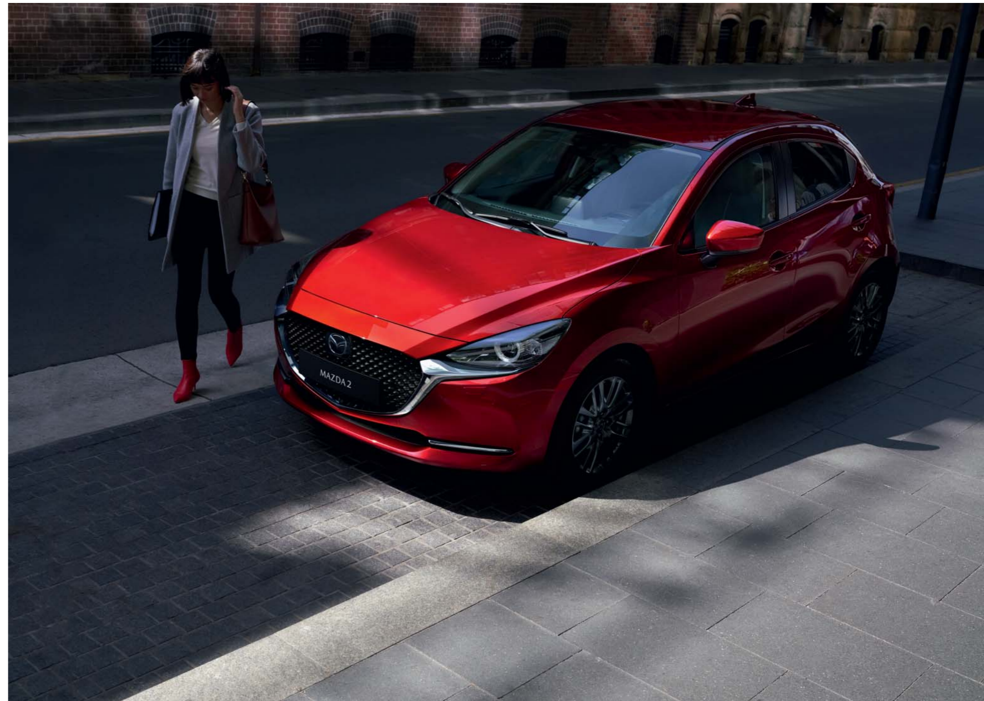
Foto: Mazda2 als Signature uitvoering in Soul Red Crystal

De Mazda2 is helemaal bij de tijd. Onze vakmensen hebben werkelijk alles uit de kast gehaald om 'm te perfectioneren. Vanbinnen en vanbuiten. En dat maakt 'm in alle opzichten verfijnd. Verrassend verfijnd.