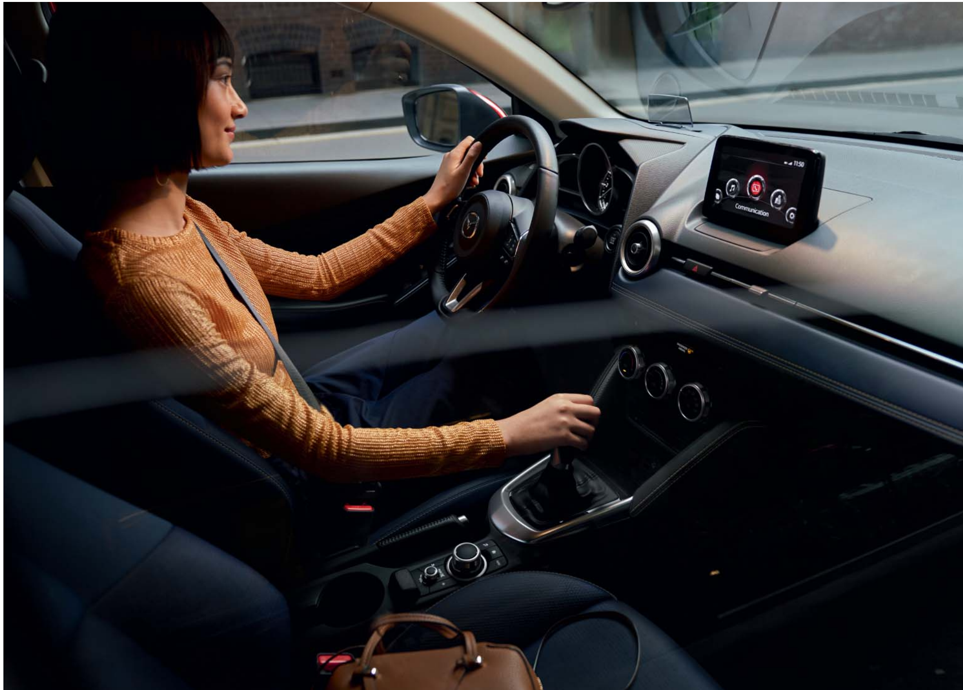
Foto boven: Mazda2 als Luxury uitvoering met i-Activsense pakket in Soul Red Crystal met donkerblauw stoffen interieur