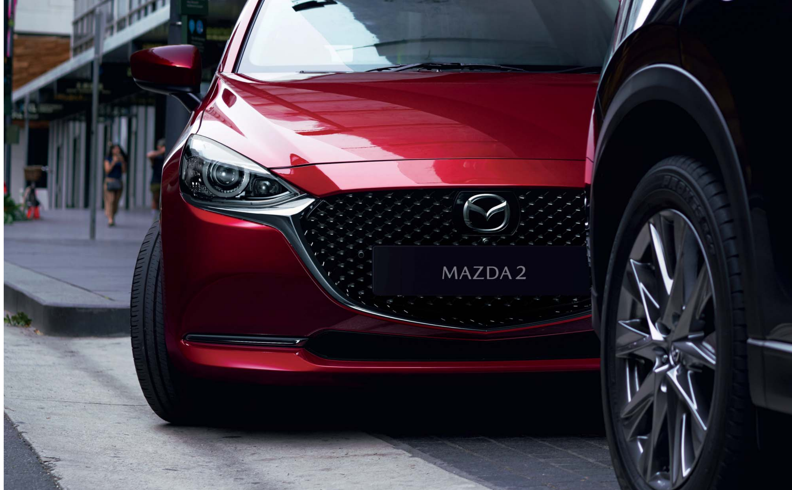
Foto boven: Mazda2 als Luxury uitvoering met donkerblauw stoffen interieur Foto rechts: Mazda2 als Signature uitvoering in Soul Red Crystal

Vanbinnen is de Mazda2 ook opmerkelijk verfijnd. Hij oogt minder druk, dankzij de zorgvuldig gekozen materialen en kleurenschema's. En het verbeterde stoelontwerp zorgt voor een ideale zithouding tijdens het rijden. Verder is de Mazda2 een stuk stiller, onze benadering van geluidscntrole zorgt dat je alleen hoort wat je wilt horen. Zo creëren we een hoogwaardig en harmonieus interieur, dat meteen vertrouwd aanvoelt.