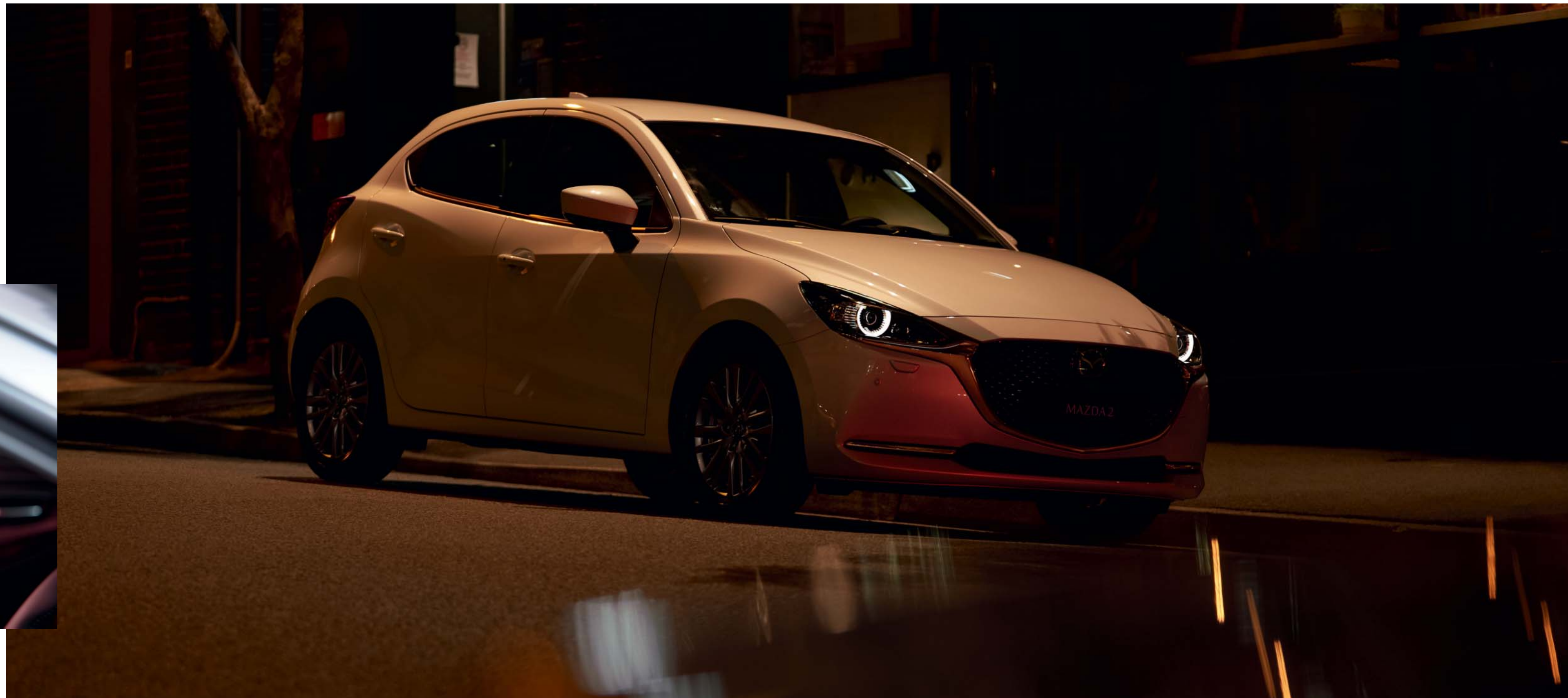
Foto boven: Mazda2 als Signature uitvoering in Snowflake White Pearl