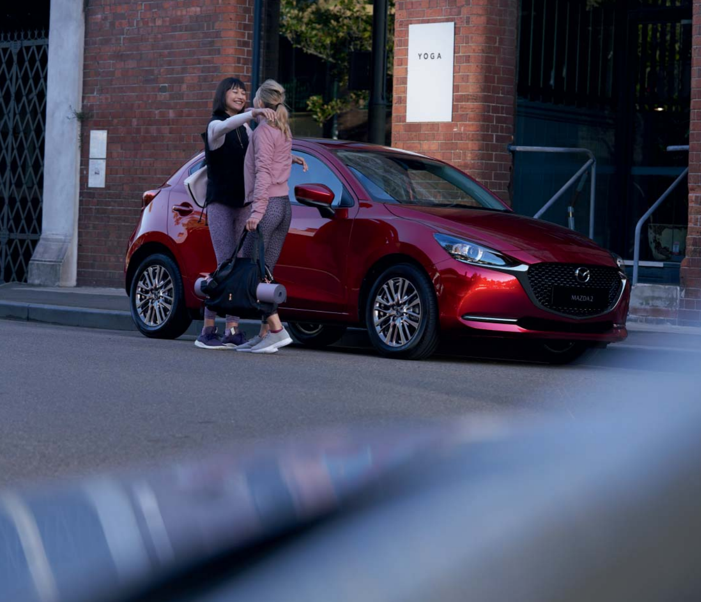
Foto boven & links: Mazda2 als Signature uitvoering in Soul Red Crystal