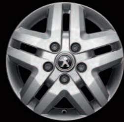
Lichtmetalen velg 16" op 400-serie