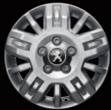
Lichtmetalen velg 15" op 300-serie